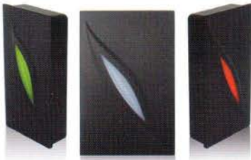
F 20102E F 20102E